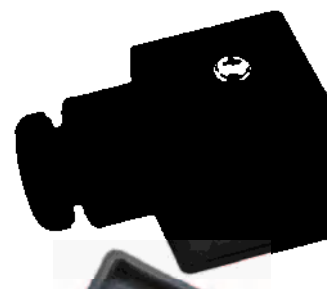
Tamaño 30-36 mm