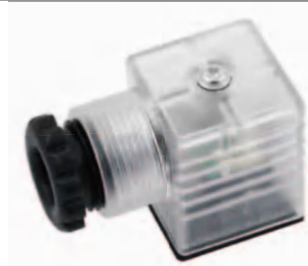
Tamaño 30-36 mm