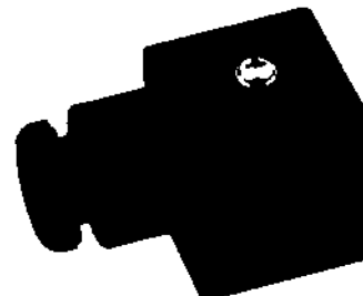
Tamaño 30-36 mm