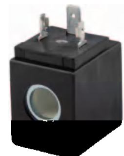
Tamaño 30 mm