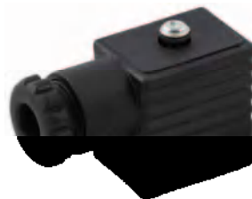
Tamaño 22 mm