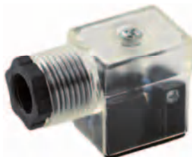
Tamaño 22 mm