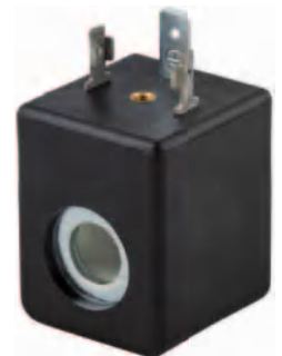
Tamaño 30 mm