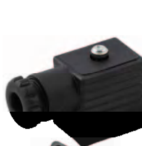
Tamaño 22 mm