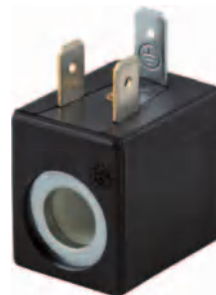
Tamaño 22 mm